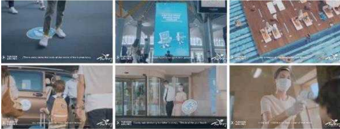
▲ 영상 'Safe Tourism Program Turkey' 중 사회적 거리두기, 캠페인과 생활방역 도구 활용 사례