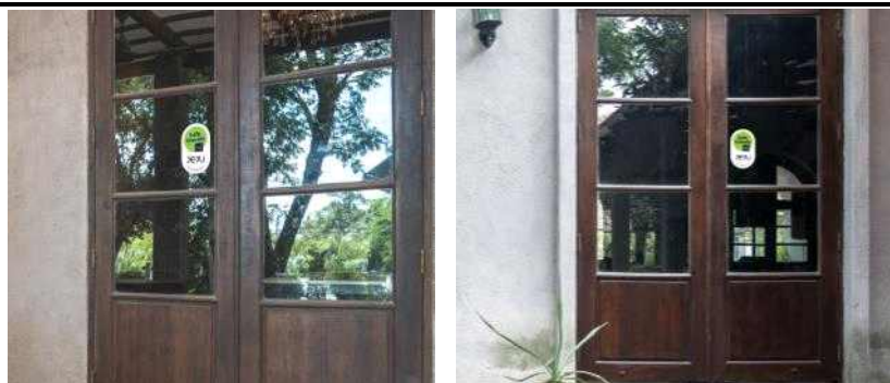
안전여행스탬프 마크 및 스탬프 사업체 적용 예시